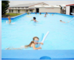
Outdoor Education / Camps