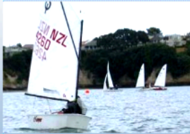
Yr 5/6 Waterwise